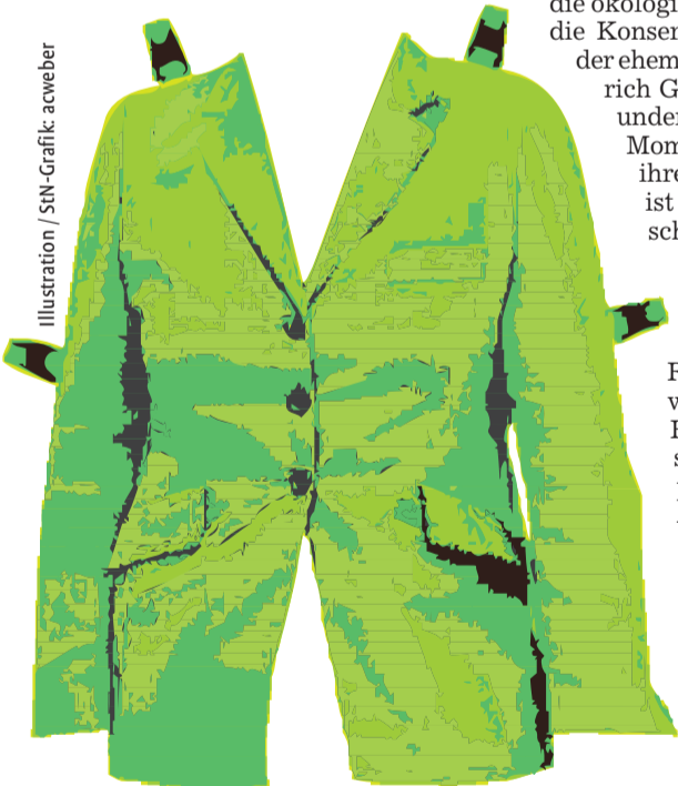
Illustration: SWN-Grafik, aeweber

sie nicht dem eigenen Typus entsprechen, drängen die Persönlichkeit stets in den Hintergrund“, weiß die Stil- und Imageberaterin Ulrike Mayer aus Besigheim. „Das ist oft gewollt. Über die Farbe werden dann kreative Eigenschaften, Macht- und Dominanzansprüche transportiert.“ Mit Rot, Orange, Grün oder Violett setzen Politikerinnen also weniger die eigene Person ins rechte Licht, wohl aber ihre Position.