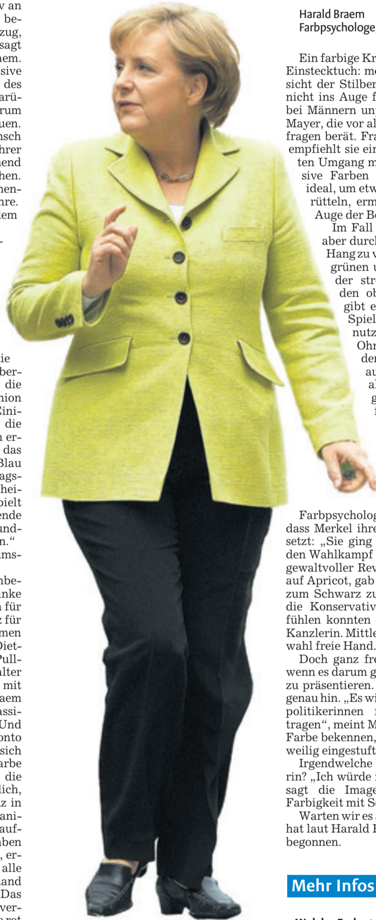
Angela Merkel kombiniert zur schwarzen Hose Jacken in wechselnden Farben